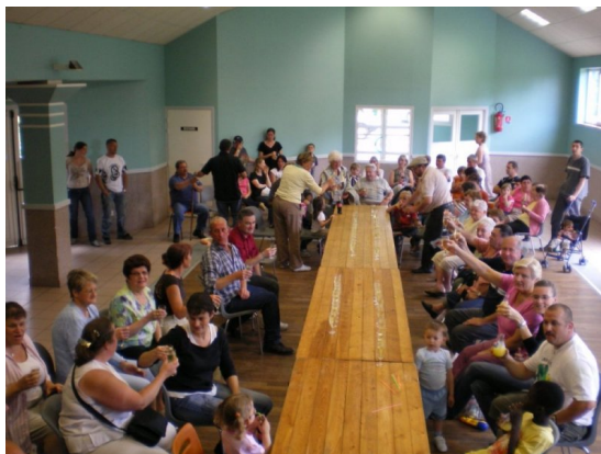
Le verre de l'amitié est levé

C'est là encore dans la tradition, que le conseil municipal a offert le verre de l'amitié aux nombreuses personnes venues assister aux jeux. Rendez-vous est donné à tous pour 2009.