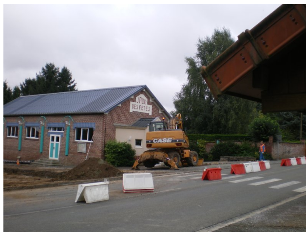
Les premiers coups de godets

On peut ainsi estimer que cette réalisation au final reviendra à environ : 160 000 € . Ces investissements nous paraissent indispensables au développement du village. Après une très longue période de baisse incessante du nombre d'habitants, qui nous amenait à un seuil critique pour espérer conserver un semblant de village. Voilà que s'amorce la croissance tant espérée avec la construction de nombreux logements qui vont remonter la population de notre commune. C'est avec un village accueillant que nous pourrions envisager la continuité de son développement.