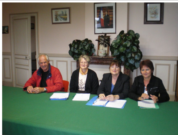
L'équipe dirigeante de "détente et loisirs "