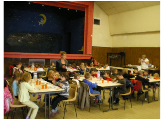
Les petits mangent en premier

C'est sous la pluie que ce mardi 2 septembre, petits et grands ont repris le chemin de l'école pour une nouvelle année scolaire. Après les premiers gros chagrins que procure chez certains petits la rupture du lien familial, ils ont commencé l'apprentissage de la vie en collectivité avec leur premier repas à la cantine. Cette année c'est un nouveau prestataire de service qui va fournir la cantine du SIVOS. Nous espérons que le choix que nous avons fait en opérant ce changement, apportera un plus aux enfants dans la diversité et la qualité des menus. Par contre l'aménagement de la semaine de 4 jours, avec la prise en compte du soutien scolaire proposé le midi, risque de perturber l'organisation de la cantine. A ce jour le transport scolaire n'est pas prévu pour les regroupements qui voudraient mettre en place ces heures de rattrapage après la classe. Comme souvent le milieu rural est défavorisé, on organise en fonction des villes, et la campagne doit essayer de s'adapter au mieux.