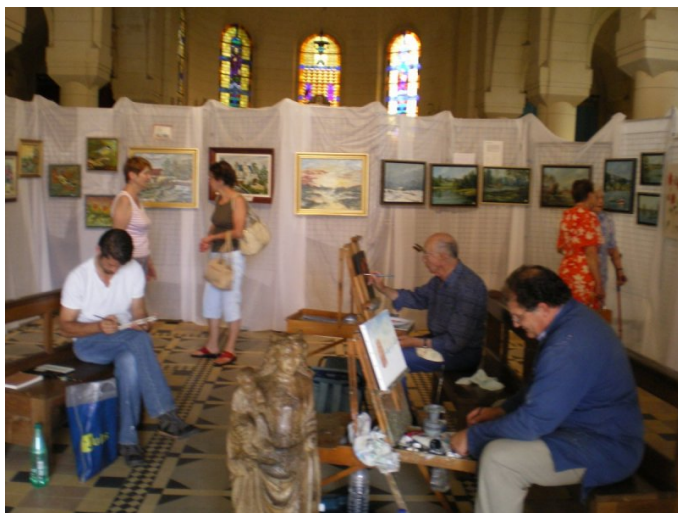
Trois artistes exposants en action