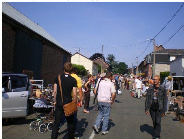
Une petite vingtaine d'exposants au vide grenier

Le vide grenier avec une petite vingtaine d'exposants a quand même attiré un bon nombre de visiteurs. Je comprends la déception de certains jeunes qui n'ont pas eu cette année de manège d'auto scooter, le forain prévu n'a pas honoré son contrat. Le chiffre d'affaire n'est plus assez important, la subvention communale et la participation du maire et des adjoints ne suffisent plus à rentabiliser sa prestation. Le thé dansant n'a pas connu l'affluence de certaines années. Merci à toutes les personnes, qui, d'une façon ou d'une autre ont participé à la fête.