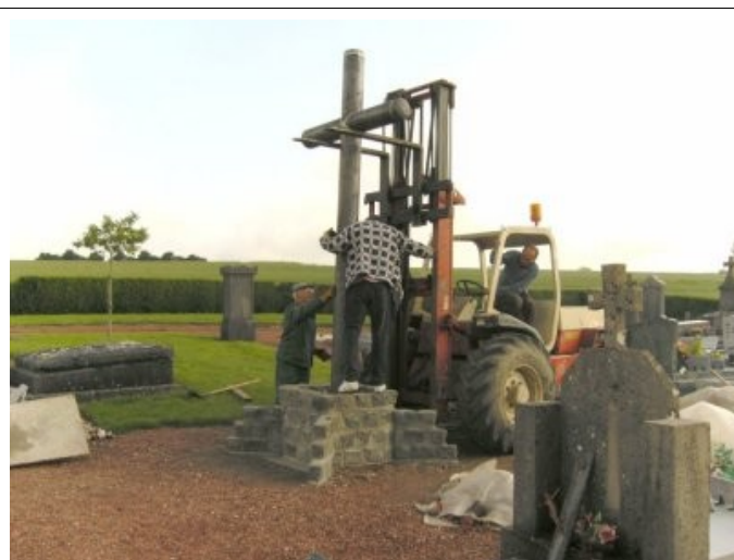
Implantation du calvaire

Le calvaire rue de Ytres a pu être réparé avec le surplus de matériaux. Le socle en béton qui se dégradait depuis quelques années a été remis à neuf. Tous les étés nous profitons de l'employé supplémentaire, embauché quelques mois, pour effectuer tous ces travaux d'entretien et de réparation qu'il serait très difficile de faire réaliser par des entreprises.