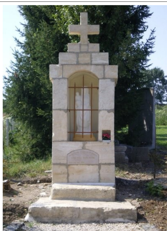
La chapelle rénovée