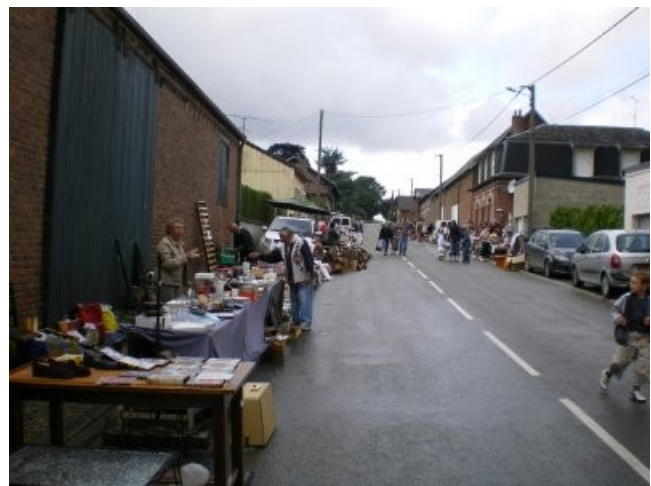
Les exposants ont-ils bien vendu ?

C'est sous la pluie que s'est terminée la fête le lundi en fin d'après midi, le mauvais temps n'a pas trop découragé les enfants qui sont venus profiter des tours de manège gratuits.