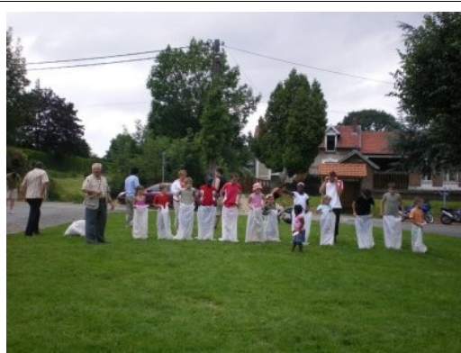
Le départ de la course aux sacs

Pour ne pas faillir à la tradition, le conseil municipal avait donné rendez-vous aux jeunes ainsi qu'aux adultes sur la place de la salle des fêtes le 14 juillet dernier. Le beau temps était de la partie pour favoriser le bon déroulement de la fête. Du jeu du foulard à la course aux sacs, du tir à la corde à la course à