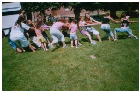
Les petits comme les grands tirent sur la corde.