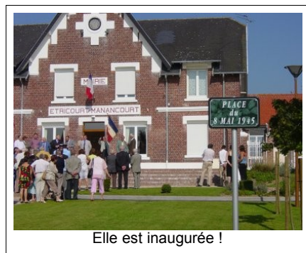
Elle est inaugurée !

A l'issue de cette sympathique cérémonie, la Municipalité a offert un lunch à la salle des fêtes pour remercier les administrés présents, ainsi que tous les acteurs financiers et techniques qui ont collaboré à la réalisation de cet espace environnemental. Après l'achèvement de ces travaux, l'heure est désormais au bilan de l'opération, c'est à dire aux chiffres, tant attendu par certains d'entre vous.