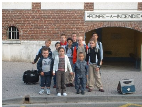
Ils en manque une quinzaine !