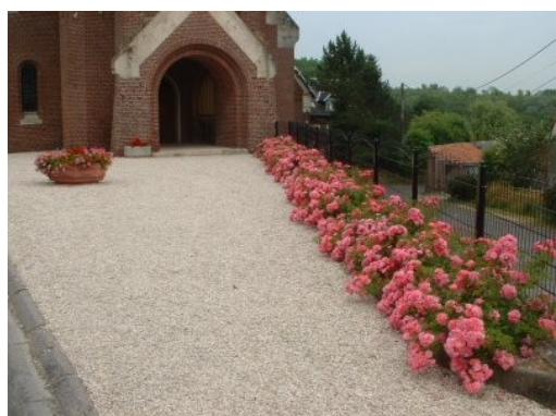
Un joli tapis de roses

Le jury qui a visité notre commune début juin, nous a félicité pour l'effort consenti dans l'aménagement de nos espaces publics et de nos plantations. C'est aussi grâce à tous ceux qui s'investissent en fleurissant ou en aménageant entrées, jardins, parterres, devantures, que nous avons obtenu ce prix des villages, dans la catégorie de 300 à 1000 habitants.