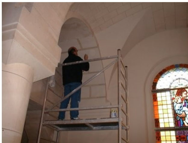
La voûte reprend forme !