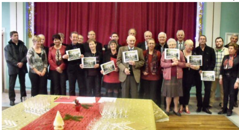
Lauréats Conseillers et Jury

Ce samedi 10 janvier les membres du conseil municipal et moi-même avons eu le plaisir d'accueillir les habitants à la salle des fêtes comme désormais chaque début d'année :