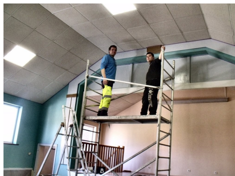
Les employés au plus haut