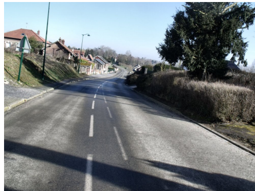
La rue à aménager

Suite aux derniers effacements des réseaux rue Principale, nous allons lancer la 4 ème tranche de travaux d'aménagements paysagers dans ce secteur. A ce jour le cabinet en charge de la maîtrise d'œuvre qui est aussi celui de la communauté de communes, travaille au chiffrage du projet, qui sera groupé dans l'appel d'offre des travaux prévus dans tout le secteur, nous devrions de ce fait profiter de meilleurs prix.