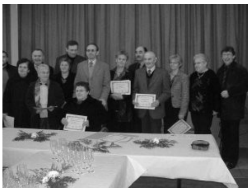
Les lauréats 2005