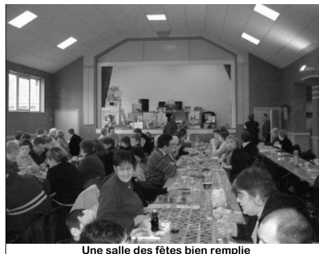
Une salle des fêtes bien remplie

Plus habitués à arpenter, champs, fourrés, taillis et bois, nos chasseurs, se sont transformés l'espace d'un dimanche après midi en serveurs et organisateurs, le tout sous la houlette de leur Président. Il faut reconnaître que leur loto-quin annuel s'est déroulé dans une très bonne ambiance et a fait de nombreux heureux gagnants.