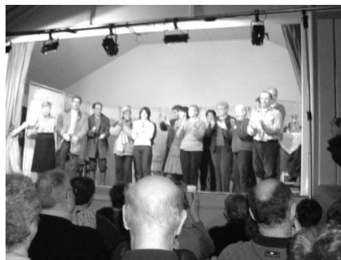
Ils étaient nombreux sur scène

Je me fais le porte parole du Président pour remercier toutes les personnes qui se sont déplacées et ont répondu à son invitation. C'est toujours encourageant pour les adhérents d'une association, qui s'investissent pour qu'elle fonctionne, de voir leurs efforts récompensés par la présence d'un public nombreux. Les membres du Conseil Municipal ne peuvent que se réjouir de voir que d'autres équipes, à leur manière, oeuvrent dans le bon sens et le plus grand désintéressement pour continuer ce que nos aînés ont mis en route.