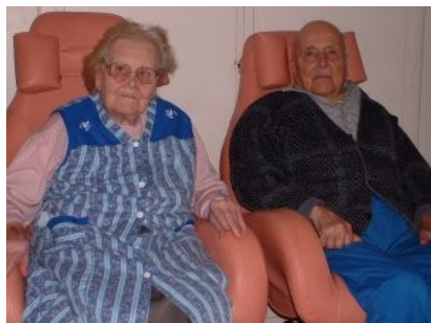
Un charmant couple bien attendrissant !