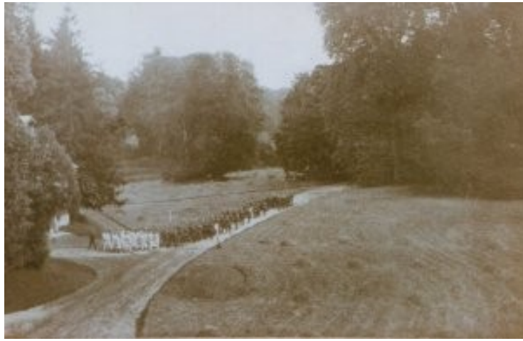
Le parc du château

Les FOLLEVILLE profitèrent largement du milliard voté à la 1 ère rentrée de LOUIS XVIII en 1814 après la bataille de Lepseiz, le bois St Pierre Waast, le bois au-dessus de l'eau, le bois Hermois et St Martin lui furent donnés en dédommagement des dégradations dont le château de Manancourt avait souffert pendant la révolution.