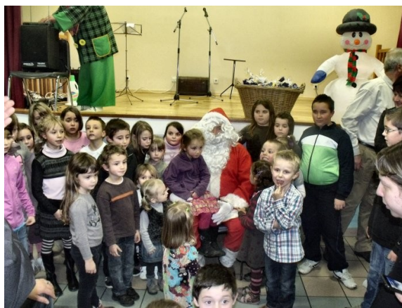
Le père Noël est bien entouré

Ce dimanche 16 décembre, les deux tiers des enfants du primaire étaient présents à l'arbre de Noël organisé par le comité des fêtes et la municipalité. C'est avec la magie que commença le spectacle. Très attentifs à tous les faits et gestes du magicien, les enfants ont manifesté un réel intérêt aux tours de passe-passe qui leurs étaient présentés. Puis la magie céda la place au ventriloque qui nous présenta son facétieux ami, la marionnette " Gaston". Les réparties de ce singulier sujet firent bien rire enfants et parents. On arriva ainsi à l'heure du goûter, moment toujours propice aux échanges, qui passa très vite. C'est en compagnie du clown vert, qui mit les enfants à contribution, que se termina cet après midi récréatif, annonciateur de ce Noël tant attendu.