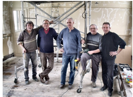
L'équipe de bénévoles

Le but n'est pas seulement de recréer une classe à l'ancienne, mais de regrouper dans un semblant de petit musée les archives, de toute nature, souvenirs du siècle passé à l'histoire pleine de richesses. Il y a encore fort heureusement au village des aînés qui peuvent certainement nous aider, en nous confiant des photos, des écrits, des récits qui sont autant de souvenirs marquants à mettre au patrimoine communal.