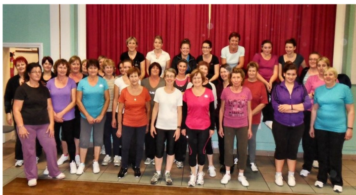
Et en avant la forme !