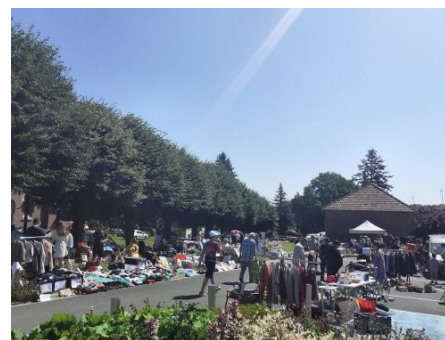
Une belle journée d'été

Après le dernier repas servi, la présidente et son équipe, ont pu s'octroyer un moment pour se restaurer à leur tour et profiter de ce moment de partage et d'échange, au terme d'une belle journée. Merci à tous les acteurs de cette manifestation, organisateurs, bénévoles, exposants et participants, qui ont contribué à la réussite en tous points de vue de ce vide-greniers, dont les bénéfices serviront comme toujours au Noël des enfants du village.