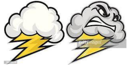
La saison des orages

Les commentaires sur les réseaux sociaux ont dévoilé des talents cachés, d'experts en hydrologie ou en remèdes efficaces pour lutter contre ces récurrentes nuisances. Il est vrai que les zones à risques du territoire communal, ont été amplifiées par le remembrement et le sont d'autant plus ces dernières années par les modifications climatiques. Dans l'attente du futur remembrement lié au CSNE, qui devra gérer l'écoulement pluvial des bassins versants, comme l'eau vient du ciel et la boue des champs ; il va falloir essayer d'améliorer ces conditions désagréables que certains subissent d'une façon cyclique. J'ai d'ores et déjà pris contact avec certains exploitants des parcelles à risques, pour établir un schéma d'emblavement afin de diversifier au maximum les cultures dans ces endroits. Aujourd'hui beaucoup d'exploitants habitent à l'extérieur du village, ce qui accentue la difficulté, ils ne se sentent pas concernés et ne participent pratiquement jamais au nettoyage. On peut comprendre que cette sorte de désinvolture, ait déclenché un signalement auprès de la gendarmerie. C'est ensuite que se pose la question de la responsabilité.