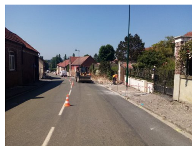
Le chantier commence

De l'effacement des réseaux commencé à la fin de l'hiver, nos travaux se sont déroulés sans interruption jusqu'en début d'été. C'est désormais un important tronçon de la traversée du village qui bénéficie de réseaux souterrains. La cadence a été soutenue dans la réalisation de ces 6 tranches, de 2004 à 2021. Ces travaux se sont alternés avec ceux d'aménagements paysagers comprenant aussi l'éclairage public. Cette année, nous avons réalisé l'aménagement du second tronçon de la Grande Rue. La configuration de cette rue a compliqué la réalisation de cet espace. La faible largeur des trottoirs n'acceptant pas la réalisation des plantations habituelles de végétaux d'ornement, nous avons eu recours à l'implantation d'un mur végétal aux extrémités. La forte pente de cette rue recevant les eaux pluviales de certaines cours nous a orienté sur le choix de trottoirs en enrobé, facilitant l'écoulement en évitant une érosion prématurée de la structure. Afin de sécuriser les usagers sortant de la rue d'En Haut et d'une cour en face, des îlots ont été implantés pour former un léger rétrécissement de chaussée.