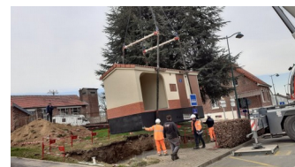
Bientôt en place

Nous l'attendions depuis plus d'un an, cet abribus-transfo qu'il avait fallu négocier pour éviter de voir implanter un de ces traditionnels transfos dont on essaie d'améliorer le look avec le concours de graffeurs plus ou moins talentueux. En tout point conforme à ce que nous attendions, il ne nous a pas déçu en le découvrant, solidement arrimé sur le camion qui l'a transporté depuis son site de fabrication occitan. Il y a des virtuoses dans de nombreux domaines, comme celui qui, perché dans la cabine de cette énorme grue, a déposé tout en délicatesse et à l'endroit précis cet élégant bloc de 17 tonnes. Content d'avoir « bataillé » pour obtenir ce transfo abribus qui a coûté 16000€ au SIER ; A ce jour trois exemplaires seulement sont en service, espérons qu'il sera apprécié et aussi respecté par les utilisateurs.