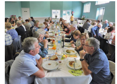
À bâtons rompus...

Ce fut comme toujours une journée bien appréciée de tous qui nous a permis de renouer avec la tradition, mais surtout de pouvoir se rassembler de nouveau.