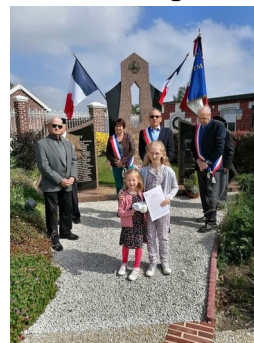
On se souvient

- « Aujourd'hui nous commémorens le 77ème anniversaire de la fin de la seconde guerre mondiale, Force est de constater que 77 ans après, le canon gronde de nouveau à nos portes. La paix est une plante fragile et délicate qui se cultive au quotidien. Sachons transmettre aux jeunes générations, l'art et la manière de l'entretenir. »