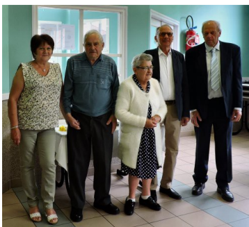
Les doyens entourés

Avant de conclure, je voudrais que nous ayons une pensée pour toutes les personnes avec lesquelles nous partageons ces moments et qui nous ont quittés. Merci à celles et ceux qui ont