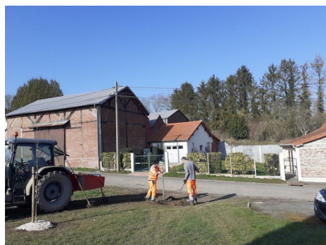
Plantation du dernier arbre