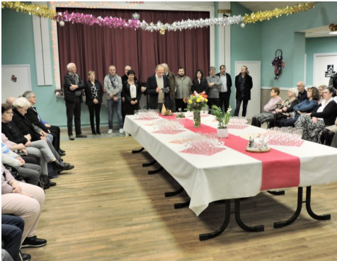
Remise des diplômes

-« Nous allons maintenant passer au volet paysager qui me tient tant à cœur.