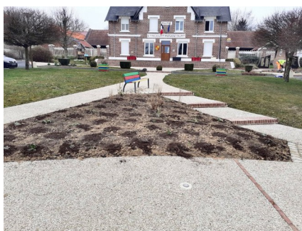
En attente de la floraison

Pendant qu'un employé communal s'adonnait à la construction mécanique, l'autre s'affairait aux préparations des futures plantations place de la mairie et à la création d'une banquette sur un trottoir au début de la Grande Rue qui sera planter en fin d'hiver. Le jardin potager communal a aussi été bêché, il est prêt pour les premiers semis et plants.