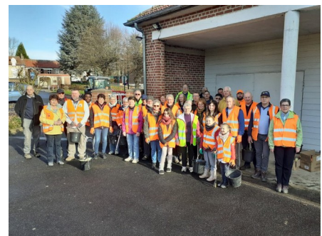
Toujours la motivation !

La petite pluie matinale n'a pas réussi à démotiver les participants et elle a même fait place au soleil au moment du départ. Les participants, équipés pour la circonstance, se sont partagés pour former 7 groupes qui se sont disséminés sur le territoire communal. Nous avons été agréablement surpris, lors du retour au point de stockage de constater la plus faible collecte depuis l'origine. Juste à déplorer un dépôt récent de pneus coupés, pour la récupération des jantes, incite à penser à l'œuvre d'un ferrailleur indélicat qu'on ne désespère pas de finir par surprendre. Le convivial casse-croûte habituel a rassemblé salle des associations tous les participants de ce rendez-vous annuel. Grand merci à tous et surtout aux enfants qui sans aucun doute sauront perpétuer cette démarche écologique.